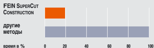
80%-ная экономия времени при обновлении стеклопакетов с помощью FEIN SUPERCut CONSTRUCTION

Благодаря пильным дискам E-Cut, работающим как “электрическая стамеска”, замена старых окон тоже не составляет трудностей. Повреждения стен и штукатурки при демонтаже оконных рам исключаются. Трудоемкая доработка отпадает. Пильные полотна E-Cut значительно облегчают также монтажные и подгоночные работы. Биметаллическое зубчатое полотно позволяет резать древесину, пластмассу, гипсокартон, штукатурку, алюминиевые профили и даже листовый металл. И, наконец, переоборудование FEIN SUPERCut CONSTRUCTION в мощную дельта-шлифовальную машинку осуществляется в несколько движений.