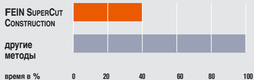
Затраты времени на удаление шовного материала

Даже самые лучшие материалы для уплотнения швов подвержены старению и подлежат замене, чтобы не произошло повреждений самого здания. Как правило, удаление старого уплотнения представляет собой трудоемкую ручную работу. FEIN SUPERCUT CONSTRUCTION с профессиональным комплектом для специалиста по санации уплотнительных швов значительно облегчает эту работу. Экономия рабочего времени достигает 60% по сравнению с работой ножовкой или ножом для ковровина. Можно вырезать любые эластичные уплотнительные материалы - внутри зданий, на фасаде или между бетонными плитами. Удаление поврежденного шва и зачистка кромок с приданием шероховатости перед новым заполнением швов производится одной и той же машинкой.