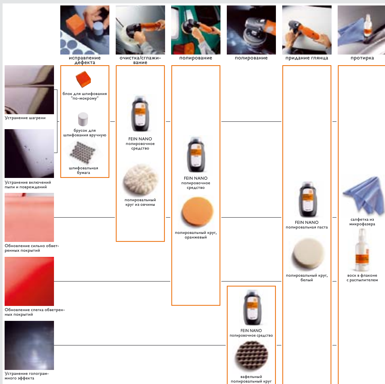
Схема условий применения средств для полирования

Только с оптимально подобранной оснасткой Вы сможете добиться лучших результатов от ручной полировальной машинки FEIN: блестящих поверхностей, продолжительного срока эксплуатации, экономичности по затратам времени и оптимального расхода полировочных средств. Для того чтобы у Вас не было проблем, фирма FEIN разработала полную систему оснастки: от полировального круга из овчины с необычно высокой производительностью, до воска, с помощью которого достигается зеркальный блеск даже на неметаллических деталях. Практичные маленькие помощники, такие как щетинная щетка, дополняют ассортимент оснастки.